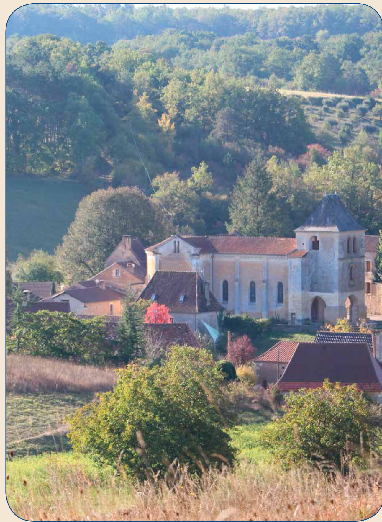
Eglise de St-Laurent-des-Bâtons XIVe